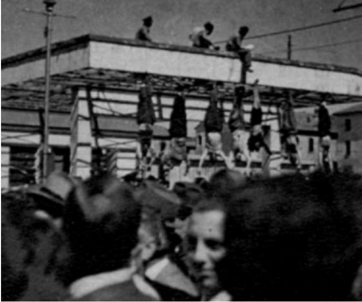
Partizanlar tarafından ele geçirilen Benito Mussolini ve sevgilisi öldürüldükten sonra ayaklarından asılarak teşhir edildi

II. Dünya Savaşı'na Almanya'nın müttefiki olarak katılan Mussolini, İtalya'yı büyük bir yıkıma sürükledi. 1943 Eylülünde Kral Emanuele tarafından tutuklandı, ancak Hitler'in emri ile bir grup komando tarafından kurtarıldı. Tekrar İtalya'ya geri döndüğünde artık eski gücünü ve itibarını kaybetmişti. 28 Nisan 1945'te bir grup partizan tarafından yakalanarak kurşuna dizildi ve daha sonra da bacaklarından asılarak teşhir edildi. Mussolini'yi iktidara getiren İtalyan halkı, daha sonra bunu çok pahalıya ödedi.