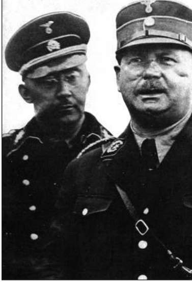
SS Lideri Himmler (solda) kendisine rakip gördüğü SA Lideri Röhm'ü ortadan kaldırma operasyonunu yürüttü.

Alman Ordusu bu katliama katılıp ellerininin kirlenmesini istemediği için, katliamı Himmler'in kara gömlekli SS'leri ve Goering'in özel polis teşkilatı gerçekleştirecekti.