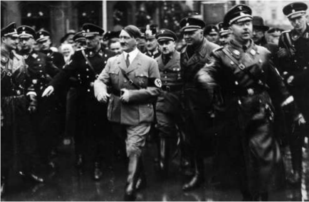
Nazi İmparatorluğu'nun dehşet saçan örgütü SS'lerin hepsi Nazi Partisi üyesiydi.

Önce orduda subay olan SA'ların başındaki Röhm ordudan ihraç edildi. SA'ların ortadan kaldırılması işi de başlarında H.Himmler'in bulunduğu yeni bir teşkilat olan SS birliklerine verildi. SS'ler bu yıllarda henüz küçük bir birlik halindeydi. Himmler tarafından teşkilatlandırılan ve Nazi partisi üyesi yapılan bu teşkilat daha sonra hızla gelişti.