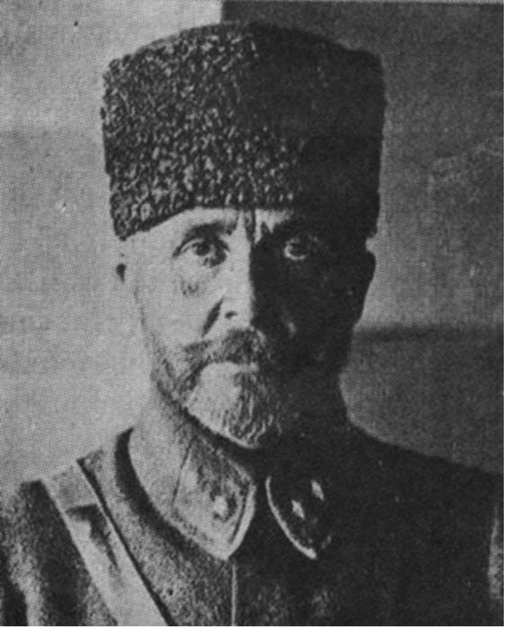
Ali Kemal'i linç ettiren Sakallı Nurettin Paşa.

ülkeye verdiği büyük zararları ve ihaneti düşündüğümüzde, hiçbir şekilde hafifletici neden olamaz. Olayların, günün tarihi koşulları altında değerlendirilmesi gerekliliği açısından bakıldığında, savaşın yarattığı yıkım ve kaotik ortamın bu tür olayların meydana gelmesine neden olduğu görülür.