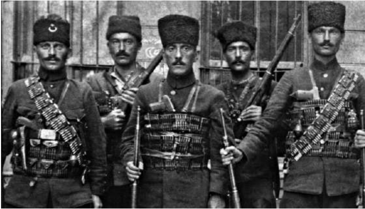
Kuvayi Seyyare Birlikleri iç isyanların bastırılmasında önemli görevler üstlendi ve milli mücadeleye büyük hizmetleri oldu

Kuvayi Seyyare Birlikleri, Milli Kurtuluş Savaşı'nda çok önemli hizmetlerde bulundu.