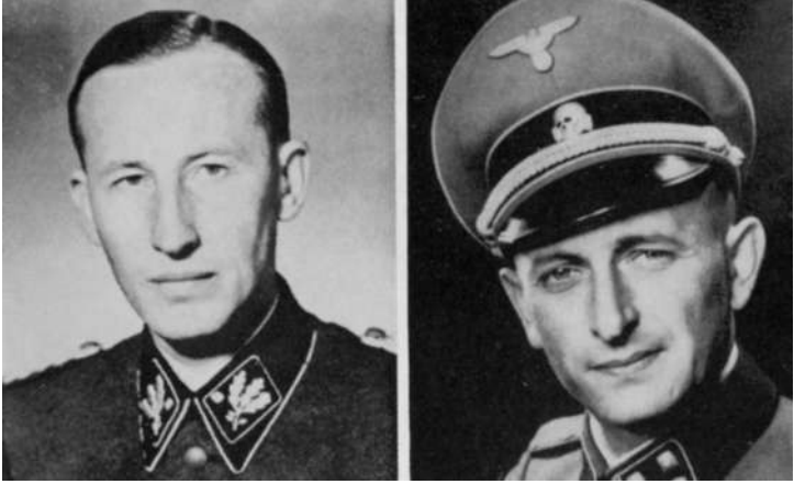
Polonya'daki Yahudiler'i imha kamplarının iki kurucusu ve yöneticisi : Heydrich ve Eichmann.

Nazi Almanyası'nda Yahudi soykırımını yöneten isimlerden biri olan Eichmann, savaşın ortasında “Nihai Çözüm” olarak adlandırılan Yahudiler'in imha edilmesi planının yürütülmesi için, Hitler ve Goering tarafından özel olarak görevlendirildi.