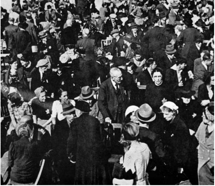
Gestapo, Fransız polisi ile birlikte Paris'te yaşayan Yahudiler'i Polonya'daki ölüim kamplarına göndermek için topluyor.

Tutukluları Vel d'Hiv'e nakletmek için getirilen otobüs ve kamyonlar meydanlarda hazır olarak bekletilir. Ertesi gün saat 11.00'de tutuklamalar son bulur. Ancak ekipler saat 16.30'a kadar evde bulamadıkları insanları aramaya devam eder. Bütün bir gün boyunca insan yüklü kamyonlar Velodrome d'Hiver'e gider gelir.