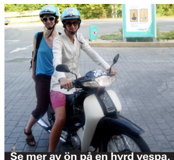
Se mer av ön på en hyrd vespa.

det mil mellan de olika intressanta platserna, men inne i Kuah, mellan Tengah och Cenang samt mellan Kok, Oriental Village med sin kabinbana och vattenfallet Telaga Tujuh kan du faktiskt promenera. Det är lite dåligt med trottoarer och de som finns är långt ifrån handikapp- eller barnvänliga med ibland 30 cm höga kliv, men avstånden är inte så stora. Och så är det ju ett bra sätt att få lite motion som omväxling till att bara slappa på stranden och äta god mat.