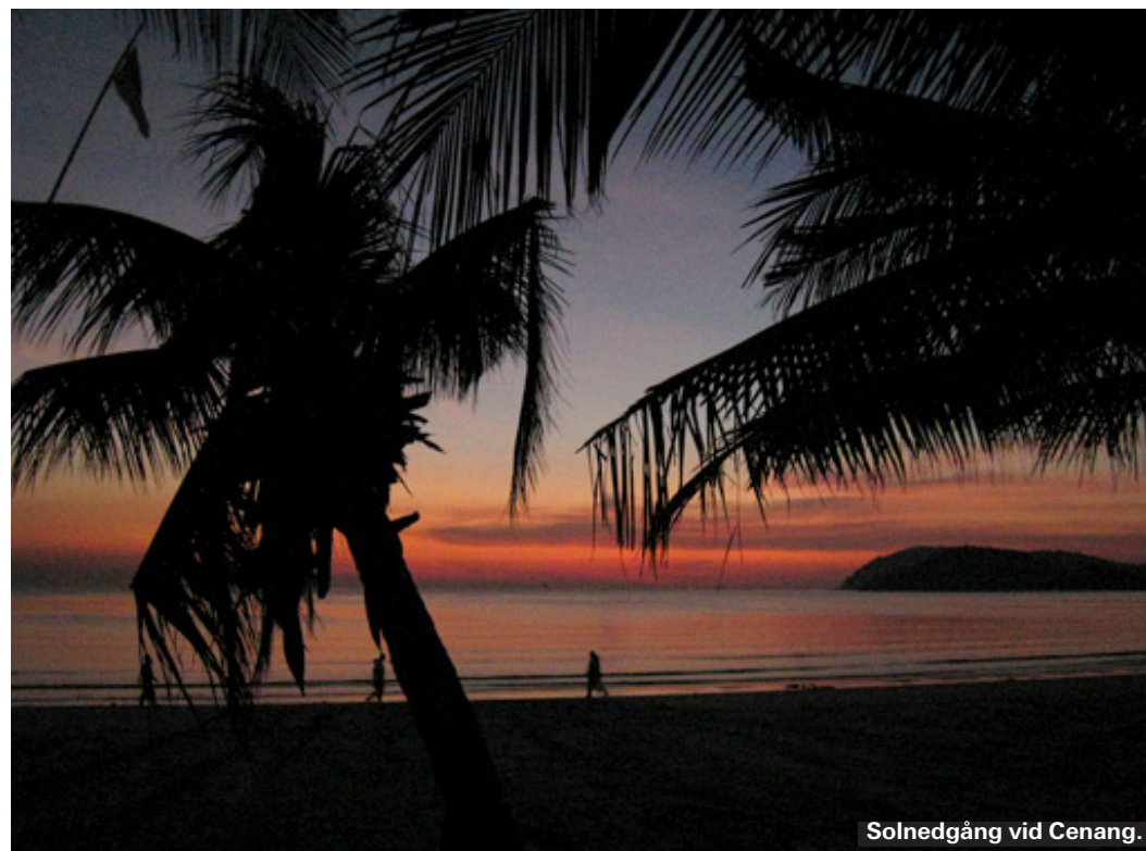
Solnedgång vid Cenang.

Känner du suget efter en riktig storstad med shopping och sightseeing så ligger Kuala Lumpur inte långt borta. Du kan flyga direkt dit med Air Asia och Malaysia Airlines. Enkelbiljett från 300 kr. Annars tar du båten till Kuala Kedah och därifrån taxi till Alor Setars busstation där det går flera dagliga turer till Kuala Lumpur för ungefär 60 kr. Du kan även ta båten till Kuala Perlis där flera bussar avgår mot Kuala Lumpur dagligen.