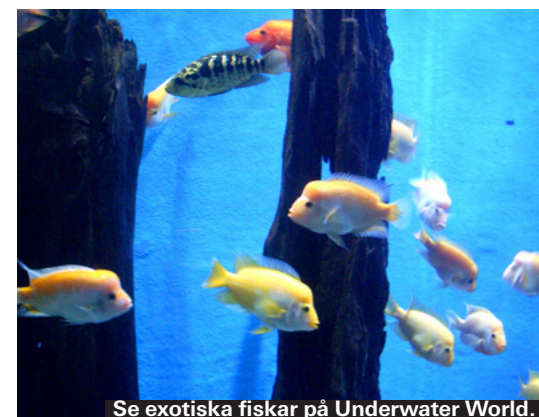
Se exotiska fiskar på Underwater World.

En marina för segelentusiaster som ligger nära Pantai Kok. Här finns ett mysigt kafé med utsikt över båtarna, ett KFC och även bensinmack, bankomater och en affär.