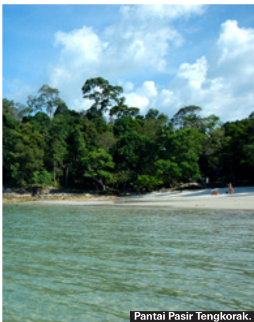
Pantai Pasir Tengkorak.