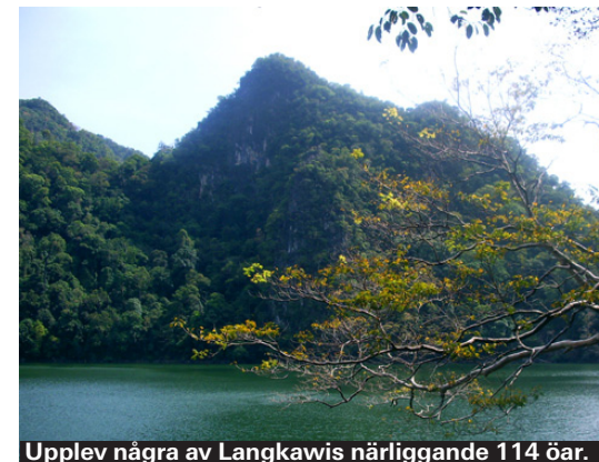
Upplev några av Langkawis närliggande 114 öar.