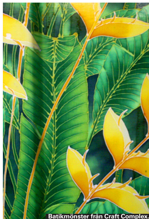
Batikmönster från Craft Complex.