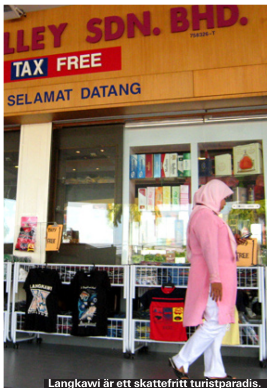
Langkawi är ett skattefritt turistparadis.

För det största utbudet av skattefria varor är det huvudorten Kuah som gäller. Langkawi Fair som ligger på väg mot färjeterminalen har ett av de bästa utbudet. Här finns förutom det vanliga även elektronik, solglasögon, kläder av olika märken som Converse och Lee samt en del dvd-filmer och musik till bra priser. Kolla även in shoppingkomplexet Parade precis väster om Kuah.