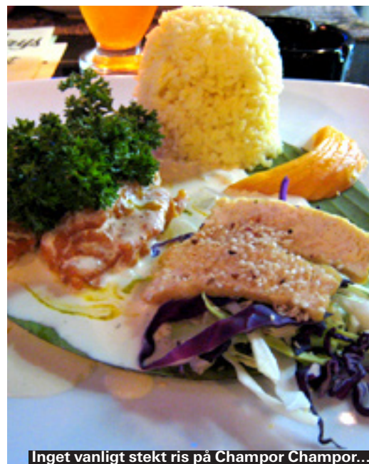
Inget vanligt stekt ris på Champor Champor...

Det märks tydligt att en stor del av Malaysias befolkning har kinesiskt ursprung. För det är inte bara skaldjuren som kan fås med kinesisk smak. Många av restaurangerna har inretts med kitschiga röda lyktor hängandes i taken. Menyerna är så omfattande som de bara är på Kina-krogar med möjligheten att välja alla rätter i liten, mellan eller stor portion och med kyckling, biff, räkor eller fisk. Exempel på rätter är valfri huvudingrediens med sötsur sås, grönsaker eller kinesisk svamp. Det här är ofta bland de billigare ställena att äta på med rätter från 20 kr.