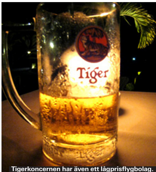
Tigerkoncernen har även ett lågprisflygbolag.

Anspråklös liten restaurang som är specialiserad på thailändsk seafood. Här kan du äta cashewnötter, ingefära och sweet and sour tills du storknar. Inga finesser men vällagat och billigt. Den enklaste rätterna kostar från 20 kr. Testa även deras milkshake.