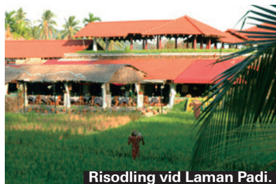
Risodling vid Laman Padi.