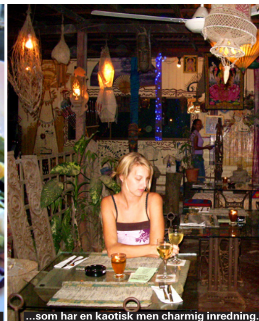
...som har en kaotisk men charmig inredning.