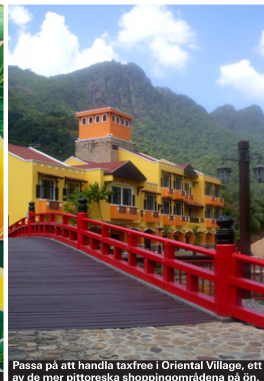
Passa på att handla taxfree i Oriental Village, ett av de mer pittoreska shoppingområdena på ön.