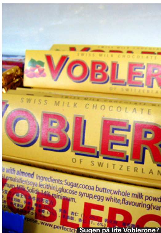
Sugen på lite Voblerone?