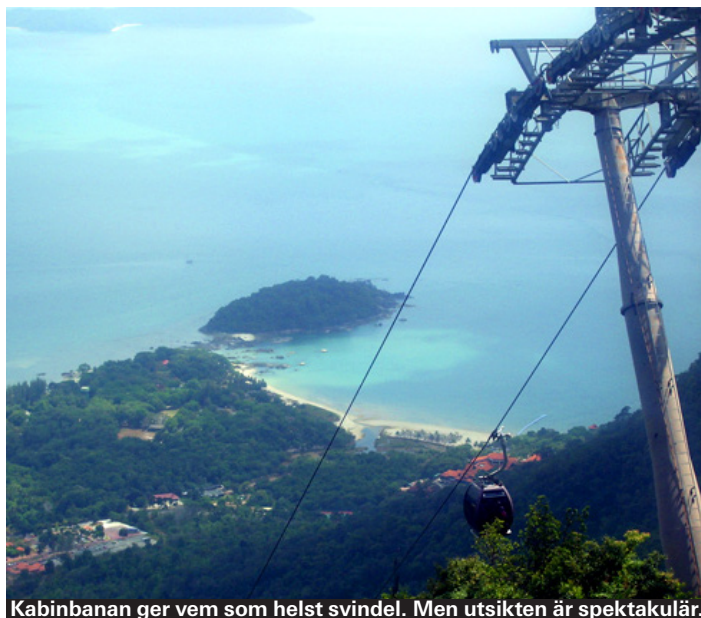
Kabinbanan ger vem som helst svindel. Men utsikten är spektakulär.

Vattenfallet Telaga Tujuh ligger bara några kilometer från kabinbanan och är ett måste om du ändå befinner dig så nära. Namnet betyder "sju källor" och kommer av att vattnet bildar sju små pooler med forsar emellan innan det till sist faller 100 meter lodrätt nerför en klippvägg. Går du till toppen (ca 500 trappsteg) kan du bada i det avsvakande vattnet, och – roligast av allt – glida på forsarna som har bildat naturliga rutschkanor. Om du åker hit under torrssäsongen kan det vara värt att fråga någon först om det finns tillräckligt med vatten för att kunna bada. Skyltat från Pantai Kok. Taxi från Tengah/Cenang kostar ca 40 kr en väg.