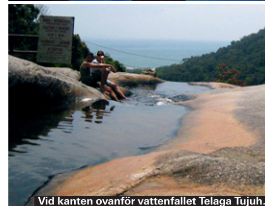
Vid kanten ovanför vattenfallet Telaga Tujuh.