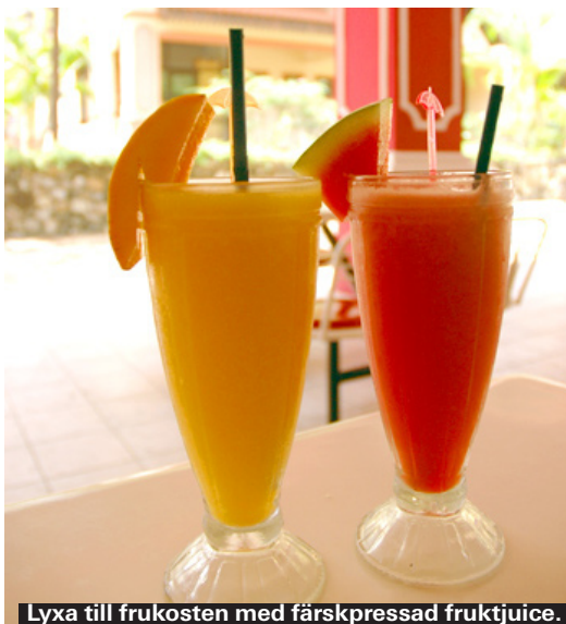
Lyxa till frukosten med färskpressad fruktjuice.