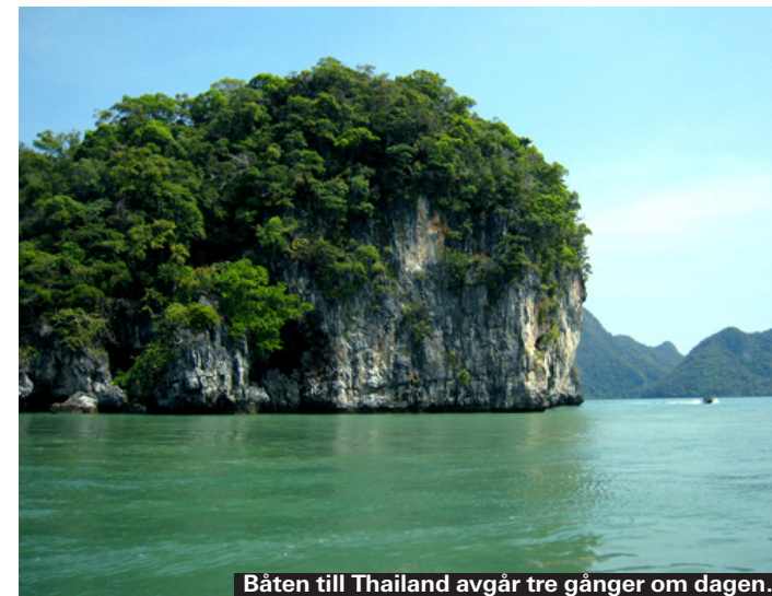
Båten till Thailand avgår tre gånger om dagen.

Drick inte vattnet från kranen, det är inte livsfarligt på något sätt men onödigt. Flaskvatten är det som gäller.