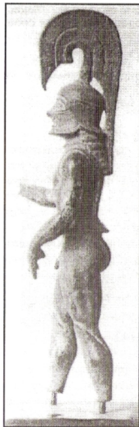
Χάλκινο αγαλματίδιο οπλίτη. Αναπαριστά Σπαρτιάτη πολεμιστή

Η ονομασία των προήλθε από την παλαιά πόλη Σκίρος . Αυτοί αποτελούσαν ξεχωριστή μοίρα του στρατού των Λακεδαιμόνιων και ήταν επίλεκτο τμήμα του. Ήταν ονομαστοί για την ανδρεία τους και ανελάμβαναν πάντοτε τις πιο δύσκολες και επικίνδυνες αποστολές. Η αρχαία Σκίρος βρισκόταν στην περιοχή μεταξύ των σημερινών κωμοπόλεων Αράχωβας και Καλλινών. Η Μοίρα των εβάδιζε πάντοτε πρώτη , προπορευομένη και αυτού