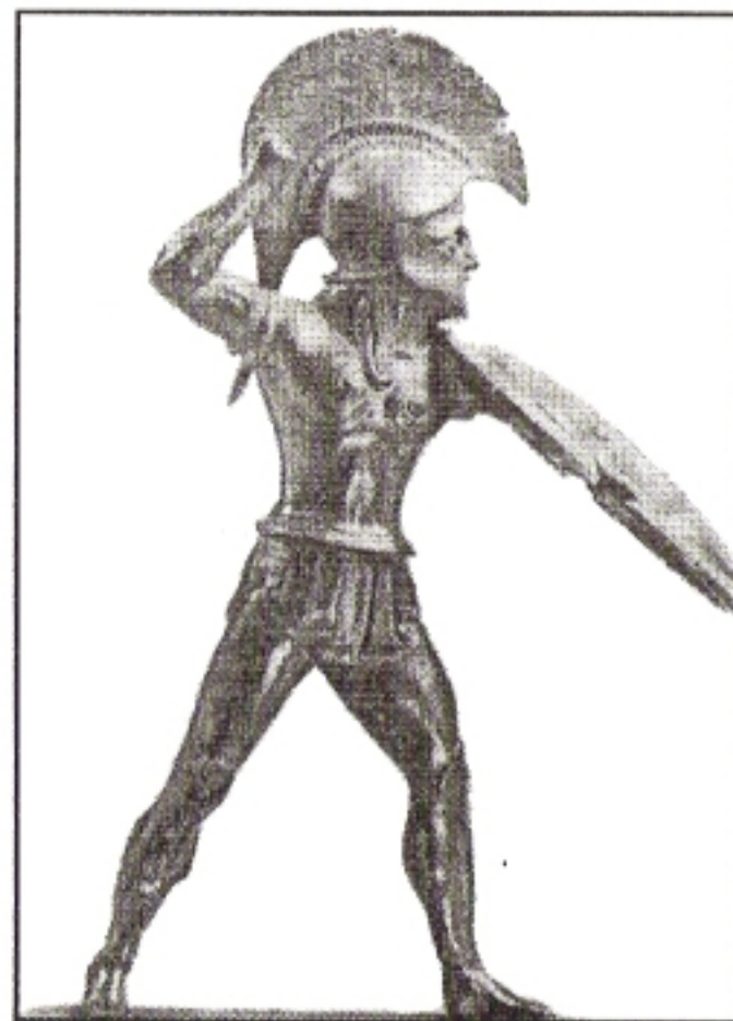
Χάλκινο αγαλμάτιο Σπαρτιάτη οπλίτη 5ος π.Χ. αι. Φέρει οκτώσχημη ασπίδα και κωδωνόσχημο θώρακα

Αργότερα, όμως και κατά την διάρκεια του Πελοποννησιακού πολέμου, τους βρίσκουμε αναμεμιγμένους στις Σπαρτιατικές Μόρες . Σ' αυτό ίσως συνετέλεσε και ο καταστρεπτικός σεισμός του 465, που προξένησε πολύ μεγάλες υλικές ζημιές αλλά και απώλειες σε ανθρώπινο δυναμικό των Ομοίων της Σπάρτης.