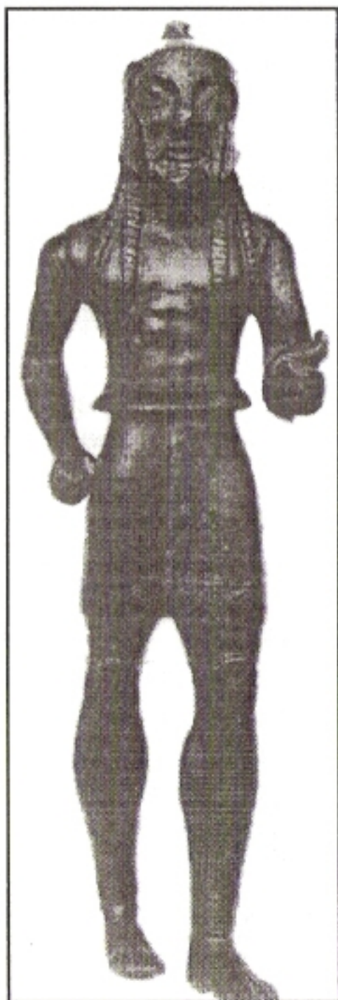
Σπαρτιάτης οπλίτης σε χάλκινο αγαλματίδιο που βρέθηκε στη Δωδώνη.

Οι βασιλείς ήταν οι μόνοι Σπαρτιάτες στους οποίους η Πολιτεία παρείχε με δημόσια δαπάνη την τροφή στα Φιδίτια , και αυτό αποτελούσε υψίστη τιμή. Οι άλλοι Σπαρτιάτες είχαν υποχρέωση να συνεισφέρουν, ο κάθε ένας από αυτούς, κατά μήνα στο Φιδίτιο σε καθορισμένες ποσότητες, σιτηρά, ελιές, οίνον, τυρί, ξερά σύκα καθώς και 10 Αιγινάιους οβολούς (δηλαδή οβολούς της δραχμής της Αιγίνης που ήταν βαρύτερη της