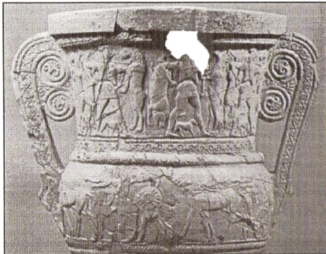
Αμφορέας των κυνηγών. (Μουσείο Σπάρτης)

Οι επιτελείς περί τον βασιλέα ήταν οι Πολέμαχοι , υπό τις διαταγές των οποίων ήταν οι Συμφορείς των Πολεμάρχων .