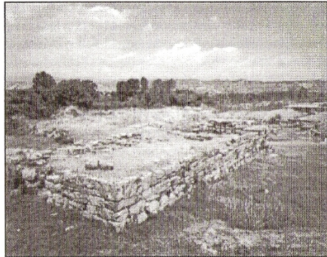
Ο Ναός της Ορθίας Αρτέμιδος

Στα ιστορικά χρόνια, κατά την εορτή των Υακινθίων , την πρώτη ημέρα, η οποία συμειωτέον ήταν πένθιμη, προσφέρονταν εναγισμοί στον Υάκινθο. Από μια χάλκινη πόρτα που υπήρχε στο βωμό-τάφο γίνονταν χοές προς αυτόν. Το βράδυ έτρωγαν μόνον τα φαγητά που επέτρεπε το ειδικό τυπικό της λατρείας. Απηγορεύονταν γενικώς τα ζυμωτά, άρα και ο άρτος. Ήταν ένα απολύτως σοβαρό δείπνο, χωρίς τραγούδια και