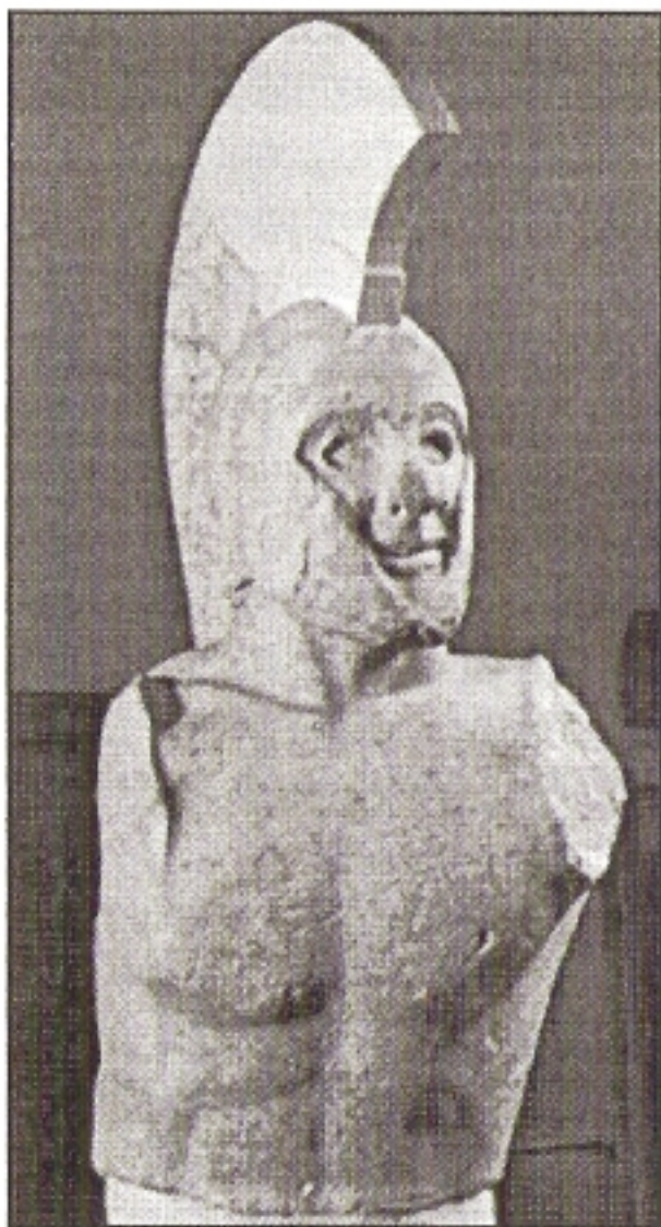
Από ένα μαρμάρινο σύμπλεγμα στημένο κοντά στο ιερό της Αθηνάς Χαλκιοίκου στα 490-480 π.Χ. σώθηκε ο κορμός ενός Σπαρτιάτη πολεμιστή στην ώρα της μάχης.

νικούν ή να πεθαίνουν. Επανερχόμενοι από τον πόλεμο, έπρεπε να φέρουν την ασπίδα τους ή να τους φέρουν έπ' αυτής νεκρούς, (Η ΤΑΝ Η ΕΠΙ ΤΑΣ, κατά την γνωστή ρήση Σπαρτιάτισσας μητέρας προς τον εκστρατεύοντα γιό της). Οι Σπαρτιάτες, που δεν εκπλήρωναν το καθήκον αυτό (ήταν ελαχιστότατοι) αλλά νττημένοι ή δειλιάσοντες επέστρεφαν στη Σπάρτη, περιέπιπταν εις σκληρή Ατιμία . Στερούνταν το δικαίωμα να αναλαμβάνουν κάποια δημόσια θέση ή αξίωμα. Δεν είχαν το δικαίωμα να πωλούν ή να αγοράζουν, και γενικώς «υπό πάντων κατεφρονούνται» . Κανένας δεν τους ήθελε συνδεί-