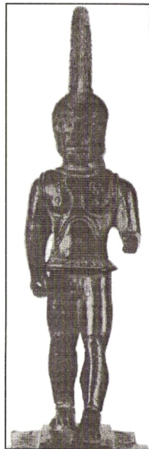
Χάλκινο αγαλματίδιο Σπαρτιάτη οπλίτη.

Με τον τρόπο αυτόν η Πολιτεία κατέστησε αυτούς ικανούς να ασχολούνται με τα στρατιωτικά και πολεμικά πράγματα και αξίωνε από αυτούς τη συνεχή ασχολεία τους με αυτά. Εξαιτίας αυτών των υποχρεώσεων πολιτικά δικαιώματα στην Σπάρτη είχαν μόνον εκείνοι οι Σπαρτιάτες οι