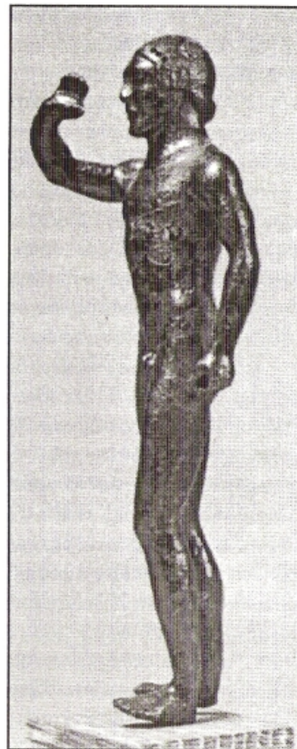
Στεφανωμένος έφηβος σπαρτιατής. (Μουσείο Σπάρτης)

Ο Σπαρτιατικός στρατός , που συνήθως αρχηγός του ήταν ένας εκ των βασιλέων (από το 510 π.Χ.) περιελάμβανε οπλίτες, τους Ομοίους , καθώς και Περιοίκους . Αυτό το βαρύ πεζικό διαιρούνταν σε έξη Μόρες , τις οποίες διοικούσαν οι Πολέμαρχοι , υπό τις διαταγές των οποίων ήταν οι Λοχαγοί που διοικούσαν τα τάγματα, οι Πεντηκόνταρχοι , που ήταν διοικητές των Λόχων και οι Ενωμοτάρχες (βαθμός που διασώθηκε έως το έτος 1984 στο ηρωϊκό, ένδοξο αλλά και μαρτυρικό Σώμα της Ελληνικής Χωροφυλακής , το οποίο το έτος αυτό κάποιοι ξενόφερτοι πολιτικάντηδες διέλυσαν ) που ήταν διοικητές των Ενωμο-