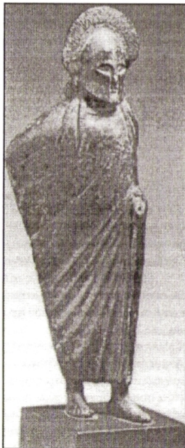
Μπρούτζινο αγαλματίδιο 5ου π.Χ. αι. Απεικονίζει Σπαρτιάτη αξιωματικό, ίσως Πολέμαρχο ή βασιλιά

μεγάλο αδίκημα «το επιβάλλειν χείρα εις αυτούς». Οι βασιλείς εσιτίζοντο δημοσία δαπάνη, μεγίστη τιμή, και ελάμβαναν διπλή μερίδα εις τα κοινά συσσίτια. Επί πλέον, οι βασιλείς ελάμβαναν και τα δέρματα όλων των θυσιαζομένων ζώων. Επίσης, ελάμβαναν από την γέννα, ανά την Λακωνικήν, εκάστης συός (θηλυκής γουρούνας) ένα χοιρίδιο. Εάν κάποιος από τους Σπαρτιάτες τελούσε δημοτελή θυσία, προσκαλούσε, τιμής ένεκεν , τους βασιλείς. Σε όλους τους αθλητικούς αγώνες είχαν την τιμητική προεδρία και όλοι «υπανίσταντο», σηκώνονταν από τα καθίσματα κατά το πέρασμά τους, εκτός από τους Εφόρους που κάθονταν πάνω