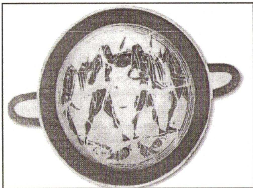
Λακεδαιμόνιοι μαχητές μεταφέρουν στους ώμους τους, τους νεκρούς συμπολεμιστές τους.

απαγορευόταν αυστηρώς να έχουν οποιουδήποτε είδους οικονομική δραστηριότητα. Για τις οικονομικές των ανάγκες, βασίζονταν στις άλλες κατηγορίες, ιδίως στους Είλωτες . Οι Σπαρτιάτες ήταν κύριοι γης, αλλά δεν την καλλιεργούσαν οι ίδιοι. Απαλλαγμένοι έτσι από κάθε οικονομική δραστηριότητα, οι Όμοιοι ή Ομοίοι αφοσιώνονταν αποκλειστικά στην στρατιωτική εκπαίδευση.