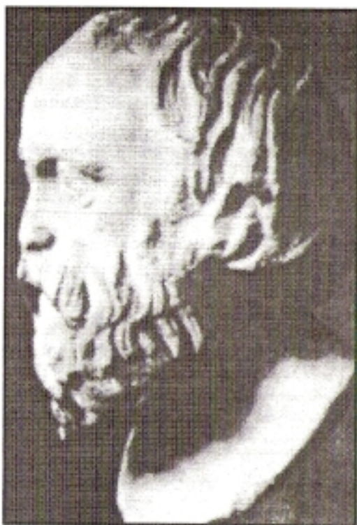
Προτομή του Λυκούργου.

Στην συνέχεια, θα αναφέρουμε, ενδεικτικώς, μερικά «μεγάλα ονόματα» Σπαρτιατών που κατέλαβαν περίοπτη θέση στην ιστορία: Λυκούργος , ο δημιουργός των νόμων της Σπάρτης, Τυρταίος , Σπαρτιάτης ποιητής του Ζ' αιώνας π.Χ. Λεωνίδας Α' , βασιλεύς της Σπάρτης, ο ήρωας των Θερμοπυλών, Παυσανίας , βασιλεύς Σπάρτης, ο νηγέτης των Ελλήνων (πλην των Μηδισάντων Θηβαίων) και νικητής εις τις Πλαταιές, Αρίμνηστος , Σπαρτιάτης, Όμοιος , ο οποίος στην μάχη των Πλαταιών εφόνευσε τον αρχηγό των βαρβάρων Μαρδόνιο , Ευρυβιάδης , ναύαρχος, αρχηγός του στόλου των Ελλήνων στην νικηφόρο ναυμαχία της Σαλαμίνας .