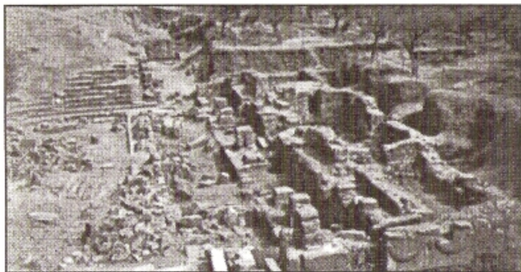
Το αρχαίο θέατρο της Σπάρτης

Οι Έφοροι εκτός των άλλων καθηκόντων τους προστάτευαν και τους Σπαρτιάτες από τα επιβλαβή ήθη ξένων τρόπων ζωής αλλά και ξένων προς αυτούς επιτηδευμάτων απελαύνοντας τους ξένους και απαγορεύοντας την παραβίαση των Πατρίων. (Πλουτ. Άγισ 10). Από την Πολιτεία στους Εφόρους ήταν ανατεθειμένη και η διαχείριση των οικονομικών του κράτους, γιατί ήταν αρμόδιοι για την φύλαξη των δημόσιων χρημάτων και των λαφύρων από τους πολέμους. Αλλά και τους φόρους αυτοί εισέπρατταν. (Πλουτ. Λυσ. 16. Διοδ. ΙΓ', 106).