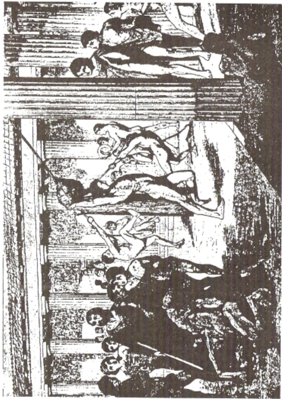
Η Σπαρτιατική νεολαία ασκούμενη στο γυμα σπώριον ή γυμνάσιον.