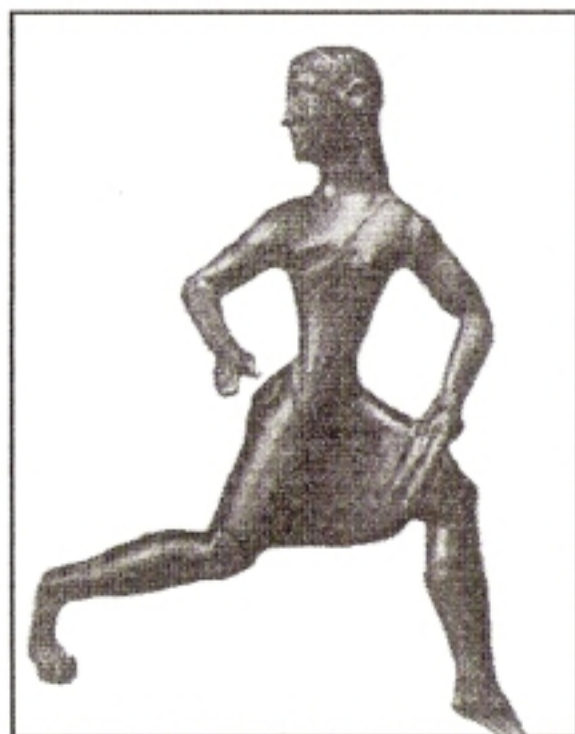
Σπαρτιάτισσα ασκούμενη στο δρόμο. Χάλκινο αγαλματίδιο.

Οι γυναίκες στην Σπάρτη είχαν πολιτική επιρροή στα