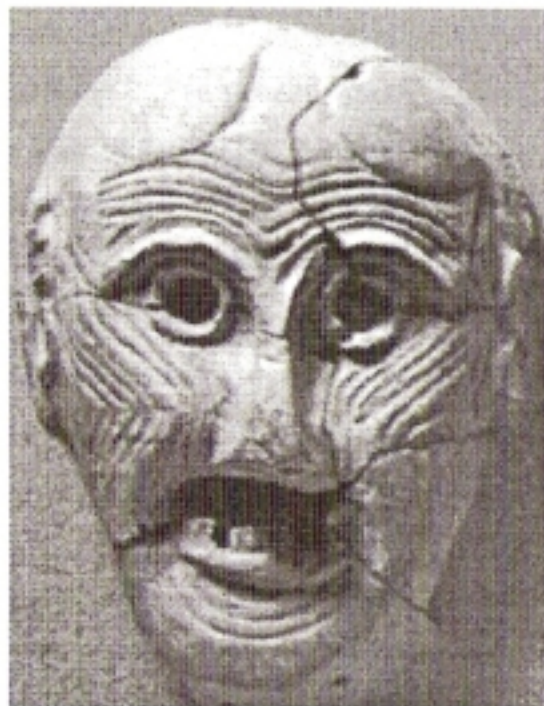
Πήλινο αναθηματικό προσωπείο του ιερού της Ορθίας Αρτέμιδος

Ευσεβέστατοι οι πρόγονοί μας. Όλοι οι Έλληνες πρόγονοί μας, και όχι μόνον οι Λακεδαιμόνιοι, στην τότε επικρατούσα θρησκεία. Τιμούσαν τους θεούς των και πάντοτε τους επικαλούνταν: «Αεί ευσεβές λοιπόν το θεοφύλακτο Έθνος των Ελλήνων».